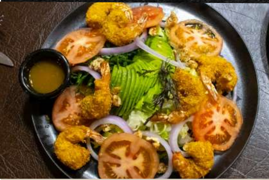
ENSALADA AL ESTILO INKA Camarones en costra de quinua crocante servido con frescas hojas de espinaca y lechuga, con aros de cebolla morada, tomate y pecanas caramelizadas.