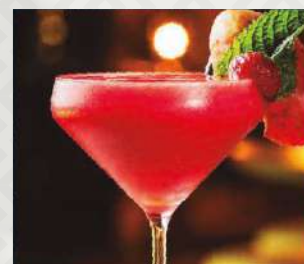
DAIQUIRI (SABORES) $5.500