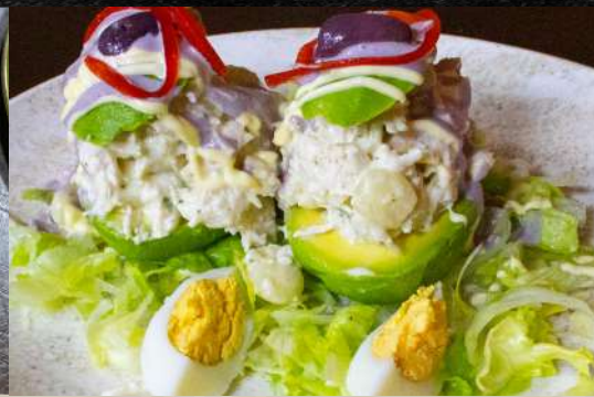
PALTA A LA REINA Canoas de palta relleno con pollo y papas cocidas aliñadas en vinagreta de la casa; servidos sobre una cama de lechuga fresca.