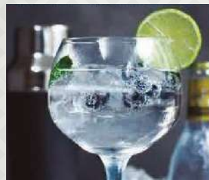
GIN TONIC $6.200