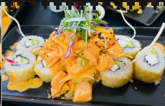
HAND ROLL ACEVICHADO Queso, nori, palta y salmon acevichado.