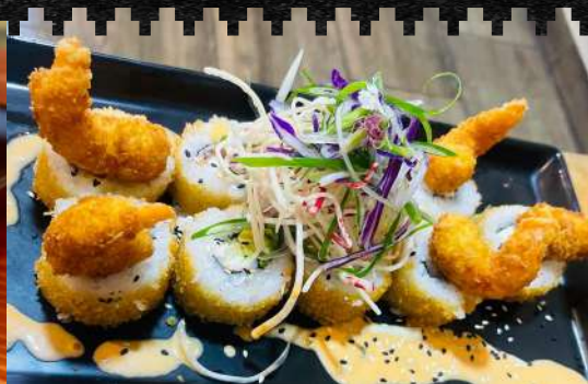
HAND ROLL FURAY Queso, nori, palta y camarón.