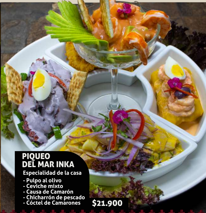
PIQUEO DEL MAR INKA Especialidad de la casa - Pulpo al olivo - Ceviche mixto - Causa de Camarón - Chicharrón de pescado - Cóctel de Camarones $21.900