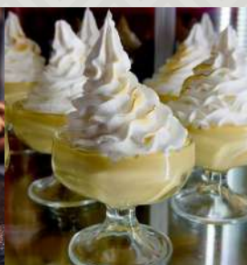
SUSPIRO LIMEÑO $3.900