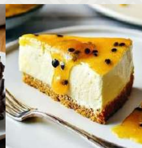
CHEESECAKE DE MARACUYA $3.900