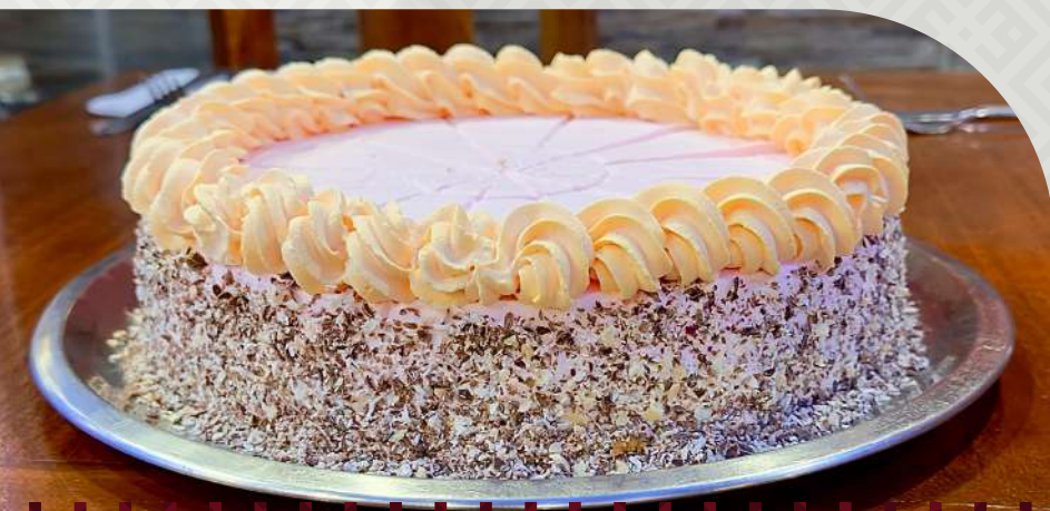
TORTAS ENTERAS $29.000