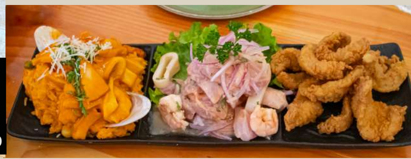
TRES MARES Arroz con mariscos, ceviche mixto y chicharrón de pescado. $14.990