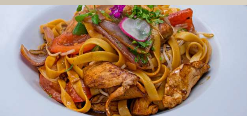
FETUCCINI AL ESTILO INKA Fetuccini cremoso al coral montado con filete a la plancha y brochetitas de pulpo y camarón en salsa anticuchera. $12.000