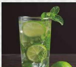
MOJITO TRADICIONAL $4.900