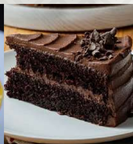
TORTA CHOCOLATE $3.900