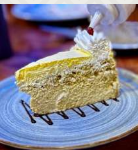
TORTA DE TRES LECHE $3.900