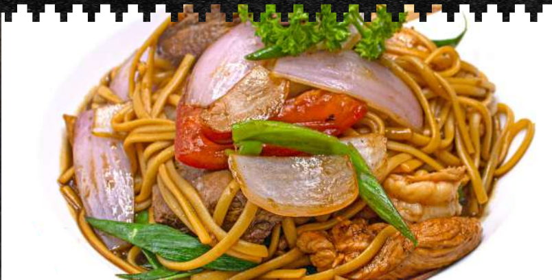
FETUCCINI A LA HUANCAINA CON LOMO SALTADO Delicioso lomo saltado sobre fetuccinis cremosos a la huancaína. $13.500