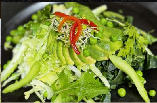
ENSALADA VERDE Frescas hojas de lechuga y espinaca, bastones de apio, arberjas y corona de palta.