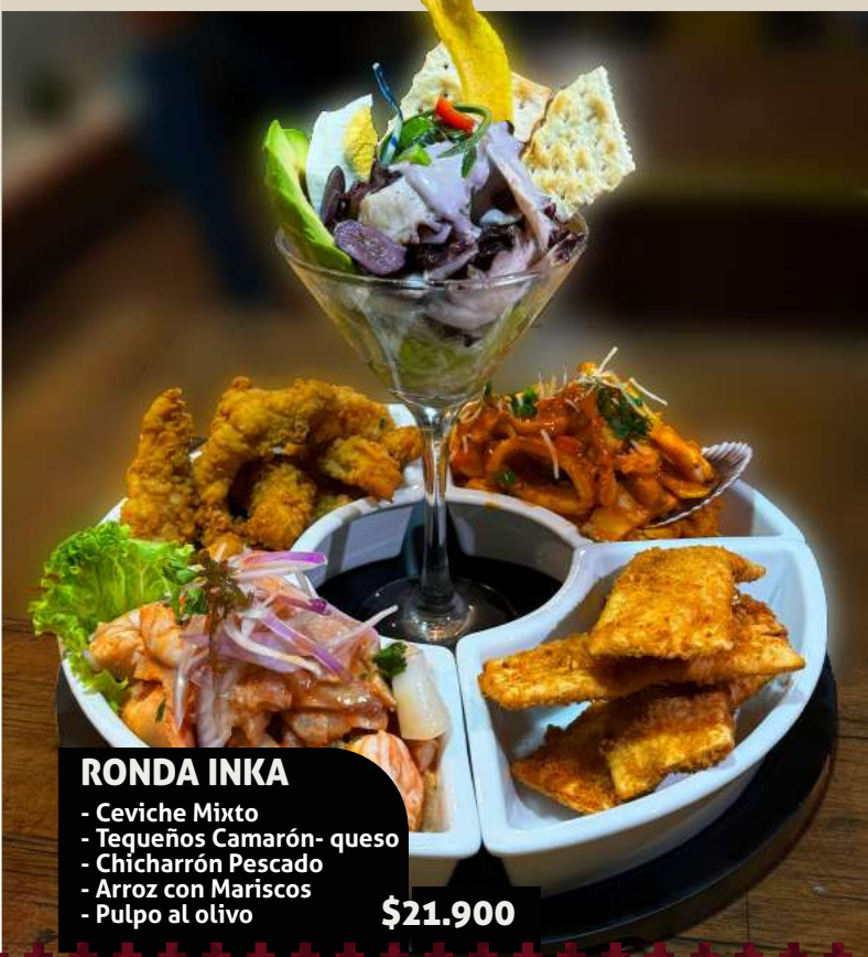
RONDA INKA - Ceviche Mixto - Tequeños Camarón- queso - Chicharrón Pescado - Arroz con Mariscos - Pulpo al olivo $21.900