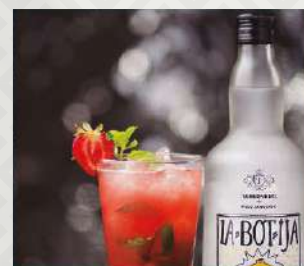
CHILCANO TRADICIONAL $4.900 CHILCANO (SABORES) $5.500