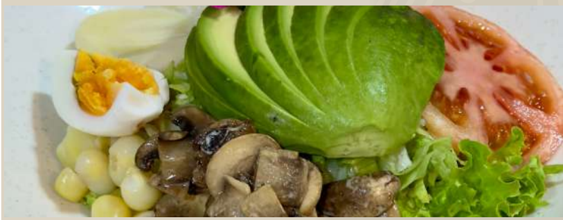
ENSALADA ESPECIAL Lechuga, palta, palmito, tomate, champiñones y choclo.