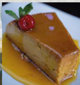
CREMA VOLTEADA $3.900