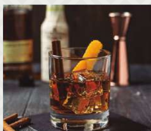
CLAVO OXIDADO $5.500