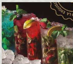
MOJITO (SABORES) $5.500