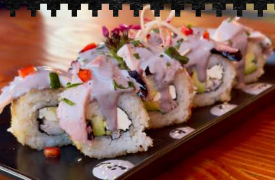
HAND ROLL DE PULPO Queso, nori, palta y pulpo.