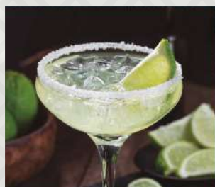
MARGARITA TRADICIONAL $5.500