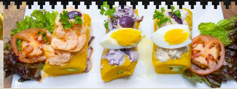
TRÍO DE CAUSAS MARINO Suave masa de papa cocida con perfume de ají amarillo montado con pulpo olivar, pulpa de jaiba y camarón. $10.990