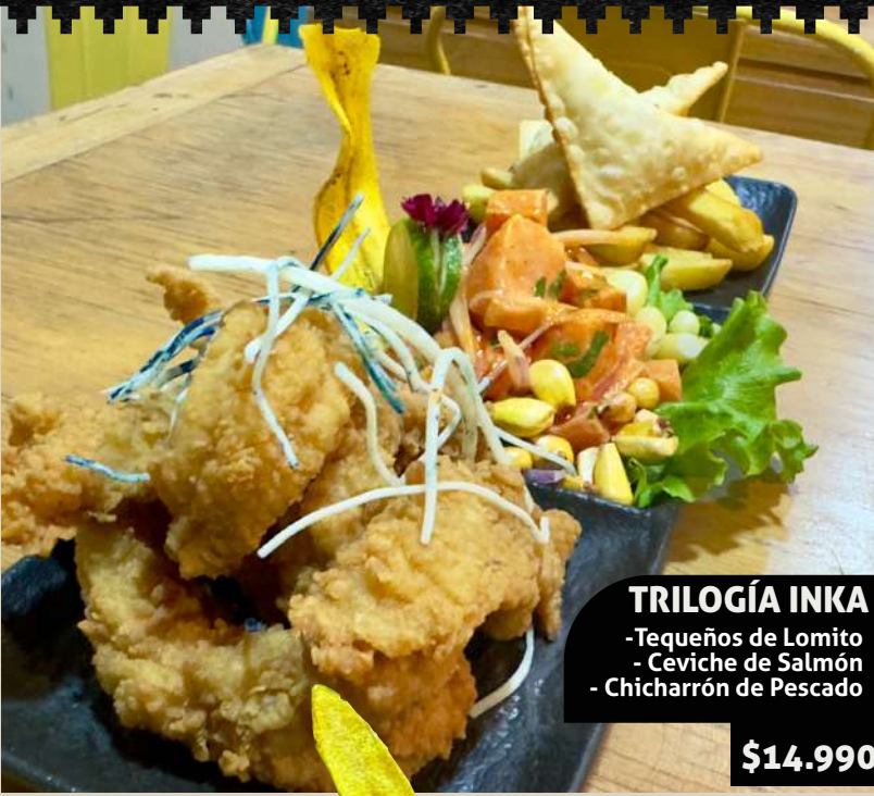
TRILOGÍA INKA - Tequeños de Lomito - Ceviche de Salmón - Chicharrón de Pescado $14.990