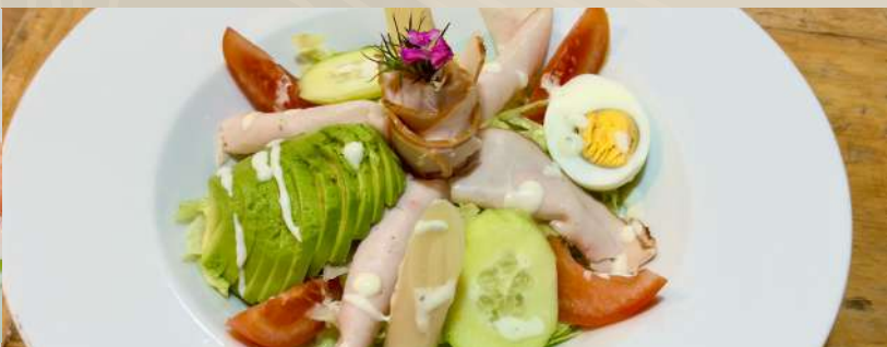
ENSALADA DE LA ABUELA Pechuga de pavo asada, lechuga, pepino, tomate, palmito, palta y servidos al mejor estilo del chef.